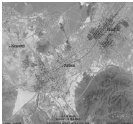
شکل ۲) عکس هوایی محدوده مشخص شده از بالا به پایین: اسلامیة، فردوس بعد از زلزله، شهر