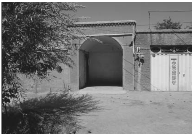
شکل ۴) ایوان ورودی در خانه‌باغ‌ها (نگارندگان: ۱۳۹۳)

۲- هشتی یا کریاس: اکثر افراد می‌پندارند که هشتی باید هشت ضلع داشته باشد. ولی در واقع منظور از هشتی آن چیزی است که از فضای داخلی خانه بیرون آمده و تنها جایی است که با بیرون خانه ارتباط دارد. ایجاد مکث، تقسیم فضایی و فضایی جهت انتظار از عملکردهای این عنصر است (پیرنیا، ۱۳۸۷: ۱۶۰). هشتی در خانه‌های فردوس فضایی کوچک و اغلب مربع شکل بوده است.