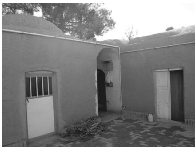
شکل ۵) حیاط و اتاق‌های اطراف خانه‌باغ‌ها، در این تصویر آجرکاری کف حیاط نیز قابل مشاهده است (نگارندگان: ۱۳۹۳)