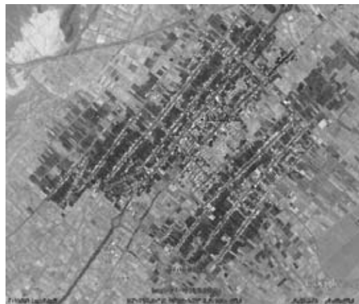
شکل ۳) عکس هوایی از خانه باغ‌های اسلامیه

از قبیل اجزای ورودی، حیاط، اتاق، ایوان و ... این خانه‌باغ‌ها گویی حاصل تجربه صدها ساله بنایان و معماران محلی بود که از هر جهت با مردم و اقلیم فردوس سازگاری دارند. هر چند در سال‌های اخیر این خانه‌ها کمتر مورد سکونت قرار می‌گیرند و اهالی به بازسازی خانه‌های خود با مصالح با دوام‌تری مانند آهن، آجر و سیمان پرداخته‌اند، اما هنوز هم خانه‌باغ‌هایی به صورت پراکنده در اسلامیه قابل مشاهده است. از این گروه می‌توان به خانه‌هایی چون مزدستان، نظری، اصلی و ... اشاره کرد.