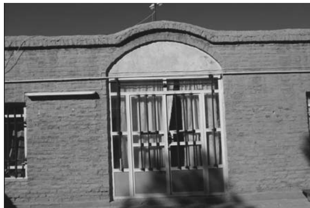
شکل ۶) نمونه ورودی یک سالن یا ایوان (نگارندگان: ۱۳۹۳)