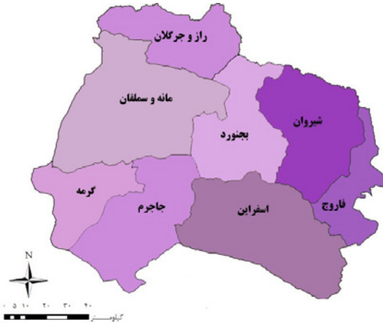
شکل ۱) موقعیت محدوده مورد مطالعه به تفکیک شهرستان

جامعه آماری پژوهش نیز کلیه شهرستان‌های استان را تشکیل می‌دهند که جهت تبیین وضعیت توزیع خدمات بهداشتی- درمانی در آنها، ۲۰ شاخص اصلی و مهم در حوزه بهداشت و درمان از آمارنامه سرشماری عمومی نفوس و مسکن استان خراسان شمالی استخراج و مورد بررسی و تحلیل قرار گرفت (جدول ۱).