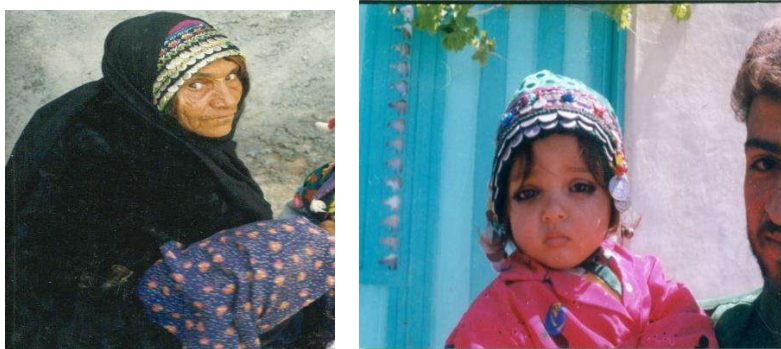
تصویر ۵. تداوم استفاده از کلوته از کودکی تا پیری (عکاس: سید احمد برآبادی، ۱۳۷۳).

معمولاً تا سنین میان‌سالی زنان به افزایش حجم تزیینات و غنی‌سازی کلاه پول خود مقید هستند. تا چند دهه پیش از این، بعد از آنکه در یک‌سالگی تا سه‌سالگی کلاه بر سر دختران گذاشته می‌شد تا پایان عمر این کلاه با ایشان در تمامی عرصه‌های زندگی فردی و اجتماعی (هنگام کار، فراغت و آیین) به عنوان بخش مهمی از پوشش سر همراه ایشان بود. هر چند موضوع اخیر در ارتباط با زنان مسن امروز نیز تداوم دارد اما زنان جوان‌تر چنشتی عموماً در عرصه‌های حیات اجتماعی و به صورت مشخص جشن‌های عروسی به استفاده از این کلاه مبادرت می‌کنند. امروز آحاد زنان جامعه‌ی چنشتی بر استفاده از کلاه پول در جشن‌های مربوط به عروسی تأکید دارند. استفاده از انواع عنصر پوشاک سنتی چنشتی به‌ویژه کلاه پولی در بستری سنتی و آیینی جلوه‌ای رنگین، خاص و باشکوه به عروسی‌ها در چنشت بخشیده است. این موضوع به حدی بوده است که مراسم عروسی روستای چنشت به عنوان یکی از نخستین پرونده‌های ثبت عناصر میراث فرهنگی ناملموس استان خراسان جنوبی دهه‌ی ۸۰ شمسی در فهرست ملی میراث فرهنگی ناملموس به شماره‌ی ۴۹ به ثبت رسیده است (طالبیان، پورعلی و حدادی، ۱۴۰۰: ۵).