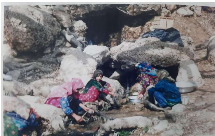
تصویر ۳. جایگزینی روسری با چارقد در ساحت‌های غیر آیینی (عکاس: سید احمد برآبادی، ۱۳۷۳)

رنگ و جنس پیراهن ایشان می‌داند. با این حال چنانکه در تصویر ۲ قابل مشاهده است، این هماهنگی لزوماً وجود ندارد. علی‌رغم آنکه چارقد از اجزای اصلی پوشاک زنان چنشتی است، در دهه‌های اخیر استفاده از آن در میان زنان به ویژه در میان زنان جوان و میان‌سال محدود به مراسم عروسی شده است. آنچه جایگزین این عنصر در پوشاک زنان چنشت شده است، انواع روسری‌ها است. با این حال زنان چنشت عموماً از روسری‌های رنگین، که پیوند آن را با پوشاک سنتی ایشان نشان می‌دهد، استقبال می‌کنند.