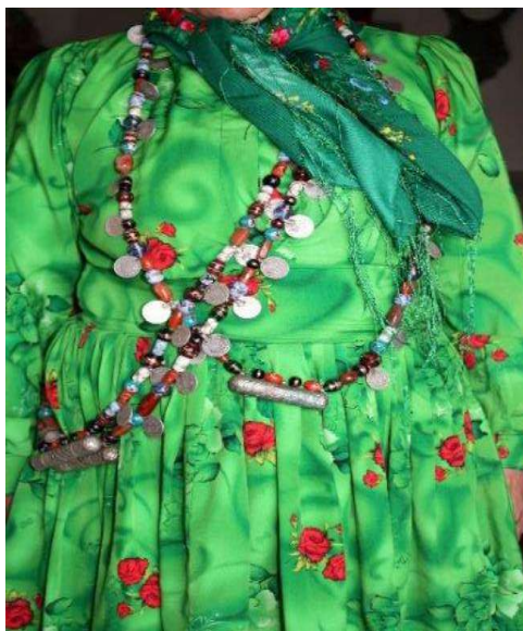
تصویر ۷. پاچین

بسیار چین‌دار، گشاد و بدون دکمه شکل یافته است. پرچین بودن پاچین چنشتی از ویژگی‌هایی است که بر مبنای داده‌های ما از دهه‌ی ۷۰ تا امروز پایداری خود را حفظ کرده است. مهم‌ترین تغییر در پاچین زنان چنشت کاربرد و استقبال بیشتر از طرح‌های گلدار و براق و افزودن مواد تزئینی مانند پولک و نگین است؛ به عبارتی دیگر، الگوی دوخت عمدتاً بدون تغییر پایدار مانده و تغییرات عمدتاً در طرح و نقش‌ها رخ داده است.