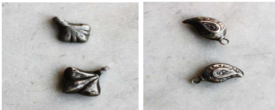
تصویر ۶. عنصر تزئینی بادام نقره و پَخُل

سکه‌های نقره در اندازه‌های مختلف شامل سکه‌های ریالی، سکه‌های چهار یک، سکه‌های نیم چارک، سکه‌های دو قرانی و سکه‌های پنج قرانی، آویزهای تزئینی از مهم‌ترین ادوات تزئین کلاه پولی است. آویزهای تزئینی عمدتاً شامل عناصری هستند که تحت عناوینی مانند بادام نقره، پَخُل، دکمه نقره، مهر سوزوک (مهره سبز)، مهرهای کریستالی و پسک شناخته می‌شوند (انوری مقدم، ۱۴۰۰: ۱۸-۲۰). در این میان با توجه به رویکرد بوم‌شناسی فرهنگی نوشتار حاضر عناصری مانند بادام نقره و پَخُل معناتردار به نظر می‌رسند. بادام نقره اشاره به آویزهای تزئینی حدود دو سانتیمتری دارد که شکلی بادام مانند و حجمی دارد. این قطعات در قسمت زیر گوش کَلوته به کار می‌رود (همانجا). آنچه در اینجا مهم به نظر می‌رسد تأکید بر بادام به عنوان یکی از محصولات چنشت است. به نظر می‌رسد می‌توان شکل‌گیری یا دست‌کم پایداری و استقبال این عنصر را تحت‌تأثیر شرایط محیطی چنشت و بادام‌خیز بودن آن ارزیابی کرد. پَخُل عنصر تزئینی دیگری است که به نوعی این معنا را بیان می‌کند. این عنصر که جنسش نقره می‌باشد، به علت شباهتش به پنجه‌ی بسته‌ی حیواناتی مانند گربه در گویش محلی تحت عنوان پَخُل شناخته می‌شود. با توجه به زیست‌بوم نسبتاً غنی چنشت که چنشتی‌ها را به صورت پیوسته در مواجهه و ارتباط با وحوشی از جنس مذکور قرار می‌دهد، به نظر می‌رسد می‌توان آنچه برای عنصر تزئینی بادام نقره بیان شده را برای عنصر پَخُل نیز بیان کرد. به عبارتی دیگر، به نظر می‌رسد حضور این عنصر می‌تواند جلوه‌ای از ارتباط عمیق مردم چنشت با پیرامون و محیط‌زیست آن‌ها ارزیابی شود.