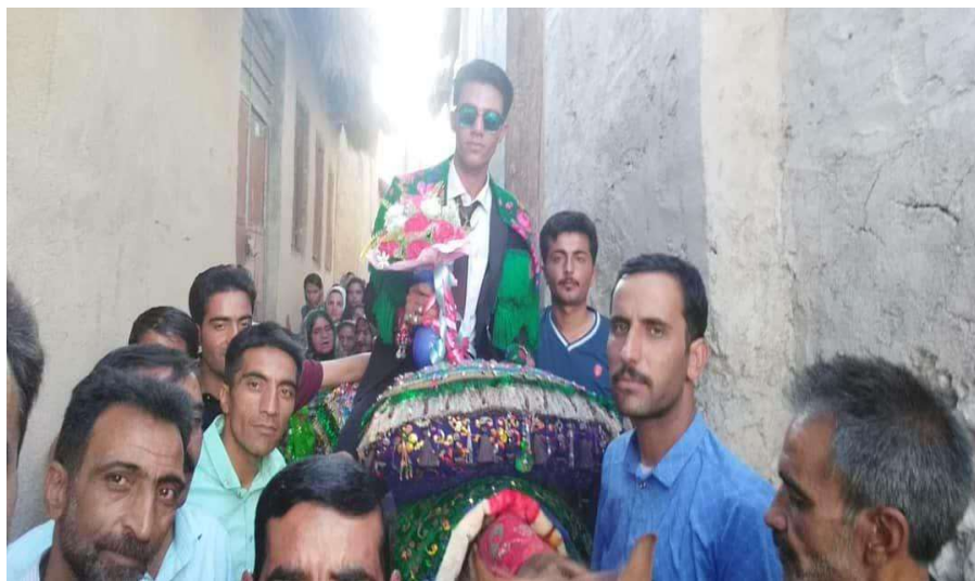
تصویر ۱. تغییرات لباس مردان چشمت

می‌دهند. این شرایط در مواردی موقعیت منحصر به فردی را برای چشمت رقم زده است. به گونه‌ای که می‌توان چشمت را تنها روستا یا از معدود روستای شرق کشور دانست که هنوز پوشاک سنتی آن به طرز تعیین‌کننده‌ای در حیات آیینی و غیرآیینی آن استمرار و پایداری خود را حفظ کرده است. با این وجود، مقایسه‌ی داده‌های ما از چشمت دهه‌ی هفتاد با وضعیت و شرایط امروز آن حاکی از تغییرات فرهنگی در این حوزه است. مهم‌ترین جلوه‌ی تغییرات در پوشاک چشمتی‌ها در حوزه‌ی لباس مردان خود را نشان می‌دهد. تا دهه‌ی هفتاد رنگ‌های آبی، سرمه‌ای و سبز رنگ غالب پیراهن مردان بوده است. این رنگ‌بندی لباس مردان چشمتی با رنگ پوشاک زنان همخوانی و قرابت دارد. با این حال، امروز حتی در سبک پوشاک مردان کهن‌سال چشمتی نمی‌توان اثری از پوشاک سنتی و تأکید بر رنگ‌بندی خاص آن مشاهده کرد. بنابراین امروزه در حوزه‌ی پوشاک مردانه میان چشمت و سایر مناطق خراسان نمی‌توان تفاوتی مشاهده کرد.