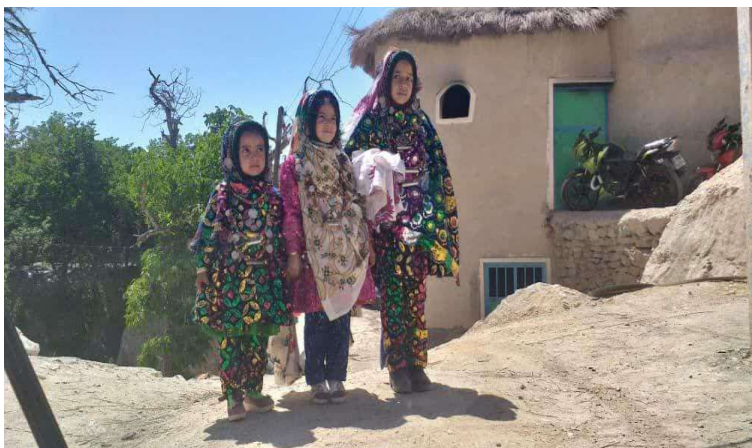
تصویر ۹. نسبت شلوار و پیراهن در پوشاک زنان چنشت

آن گشاد و راحت طراحی شده است. در سال‌های اخیر پولک‌دوزی روی شلوار زنان چنشتی متداول شده است؛ این تغییر امروز به صورت مشخصی برجسته‌ی برای پوشاک زنان قابل طرح است. پاچه‌ی شلوار زنان چنشت مانند شلوار سنتی سایر نقاط جنوب خراسان معمولاً تنگ و نسبت به شلوار سنتی مردان گشادی آن کمتر است. در هر صورت پاچه معمولاً دو تخته پارچه به کار می‌رود و قسمت بالا گشاد است و در ناحیه‌ی میج پا تنگ می‌شود. در برخی موارد پارچه و طرح آن در پیراهن و زنان چنشت یکسانی است. با این حال این یک اصل کلی در سازمان‌دهی به پوشاک زنان چنشت به نظر نمی‌رسد. در تصویر این هماهنگی و عدم هماهنگی را می‌توان مشاهده نمود.