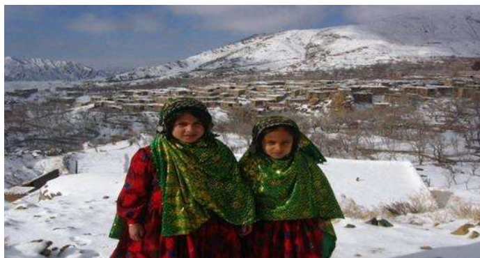
تصویر ۲. چارق‌د زنان روستای چنشت

منطقه‌ی سبزوار در جشن‌ها از نوعی چارق‌د فاخر و گلدار که در آن منطقه تحت عنوان «چارق‌د بخارایی» شناخته می‌شود، استفاده می‌کنند (مقصودی و غربی، ۱۳۹۲: ۱۶۴). در روستای چنشت، این عنصر تحت عنوان «چارق‌د مله» ۱ شناخته می‌شود. چارق‌د زنان چنشت به شکل مستطیلی با عرض یک و نیم و طول دو متر است. چارق‌د مله در کنار کُلوته، که در ادامه شرح خواهد شد، اجزای اصلی پوشش زن چنشتی را شکل می‌دهند. چارق‌د و کُلوته با منطقی خاص کنار یک دیگر قرار می‌گیرند. چارق‌د زنان چنشتی باید زیر کُلوته و عقب‌تر از آن قرار گیرد. در این چارچوب بعد از آنکه موقعیت چارق‌د و کُلوته تنظیم شد، زنان چارق‌د را به دور سر خویش پیچیده و با سنجاق محکم می‌بندند. داده‌های ما در دهه‌ی ۷۰ شمسی حاکی از آن است که تا پیش از این دهه، بخش مهمی از چارق‌دهای زنان به صورت بافت با استفاده از دستگاه فرت‌بافی در روستا تهیه می‌شده است. این در حالی است که امروز عموماً از پارچه‌های بازاری برای تهیه چارق‌د چنشتی استفاده می‌شود.