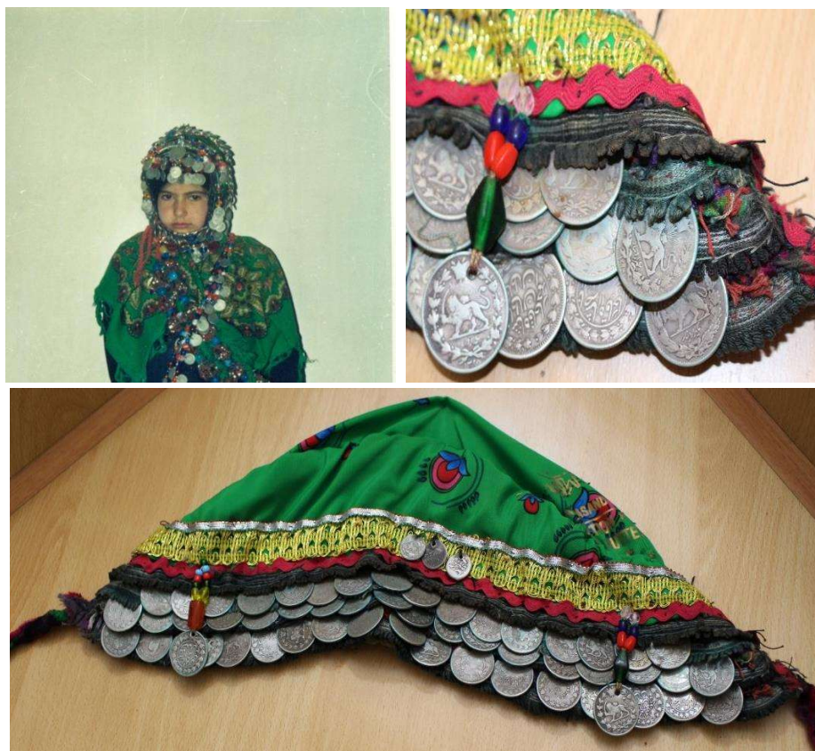
تصویر ۴. کُلوته یا کلاه پول

کلاه مورد بحث برای دختران یک‌ساله تا دوساله تهیه می‌شود. بعد از تهیه‌ی اولین کلاه پولی، اندازه و حجم تزیینات آن به فراخور رشد فرد توسعه و گسترش می‌یابد. در روز عروسی دختر، کلاه نهایی شده با تزیینات کافی توسط مادر عروس به عروس هدیه داده می‌شود. در این روز، عروس از خانواده‌ی خود زیورآلات بومی و محلی دیگری نیز دریافت می‌کند. این زیورآلات که