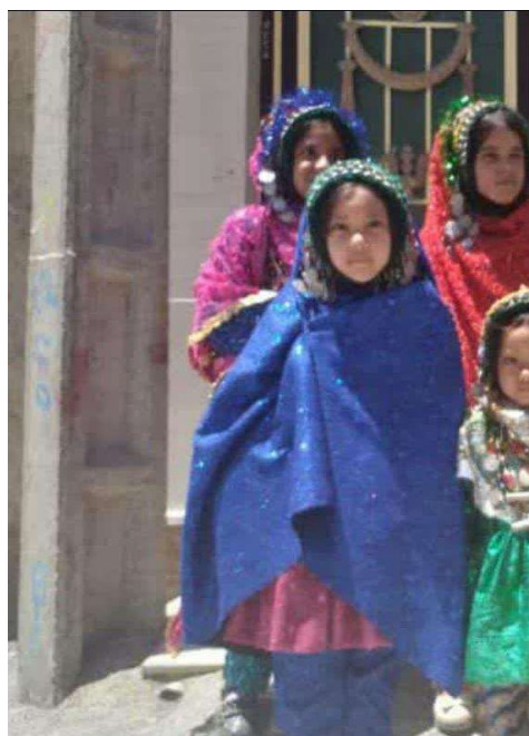
تصویر ۸. کیش

معمولی کوچک‌تر و کوتاه‌تر است و از پشت سر آویزان می‌شود. کیش در چنشت در بستر مراسم عروسی مورد استقبال زنان چنشتی قرار می‌گیرد. چنانکه گذشت معمولاً در چنشت زنان از کیش‌های با رنگ‌های شاد مانند قرمز، سبز و آبی استقبال می‌کنند. این موضوع هماهنگی عنصر پوشاک زنان چنشت را نشان می‌دهد. در سال‌های اخیر استفاده از کیش در میان زنان جوان چنشتی کاهش یافته و ایشان به استفاده از چادر تمایل بیشتری نشان داده‌اند. البته این چادر هم با مختصات پوشاک چنشتی که رنگین بودن و گلدار بودن یکی از مشخصه‌های آن است، همخوانی دارد. چادر مورد اشاره نیز مانند کیش از پشت سر آویزان می‌شود؛ با این تفاوت که اندازه‌ی طول آن بیشتر است و تا قسمت مچ می‌رسد. با این حال هنوز زنان مسن از همان کیش استفاده می‌کنند.