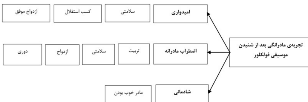
شکل ۲. مضامین و زیر مضامین تجربه‌ی مادرانگی در زنان مشارکت‌کننده

یکی از محورهای اصلی این پژوهش واکاوی و بازنمایی تجربه‌ی مادرانگی در نزد مشارکت‌کنندگان بود. ادراکی که این زنان از مادربودگی‌شان داشتند، ارتباط مستقیم و بی‌واسطه‌ای با تجارب موسیقایی آنان داشت. مصاحبه‌شنونندگان قبل از هر چیز باور داشتند که موسیقی فولکلور در خود مضامین مادرانگی را دارد و این مضامین نیز به نوبه‌ی خود مؤثر در تجربه‌ی آنان در مادرانگی خودشان در حین گوش دادن به آن‌ها دارد. تحلیل روایت‌ها و گفته‌های مشارکت‌کنندگان به شناسایی سه مضمون اصلی و هشت مضمون فرعی درباره‌ی تجربه‌ی مادرانگی بعد از شنیدن موسیقی فولکلور انجامید.