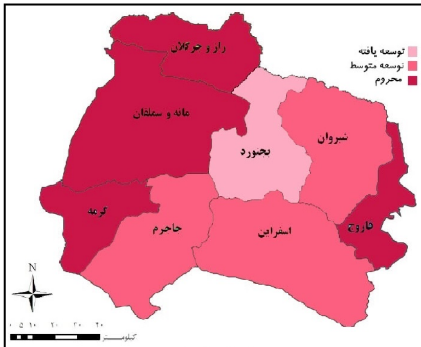
شکل ۲) سطح‌بندی شهرستان‌های مورد مطالعه بر حسب سطح برخورداری

طبق مقادیر به دست آمده جهت ترسیم شمالی کلی استان خراسان شمالی در بخش بهداشت و درمان، شهرستان‌های استان را می‌توان با استفاده از روش تحلیل خوشه‌ای سلسله‌مراتبی می‌توان در سه خوشه یا سه سطح طبقه‌بندی نمود. سطح نخست (با ضریب بین ۰/۶۶۷-۱ مناطق توسعه یافته)، سطح دوم (با ضریب بین ۰/۳۳۴-۰/۶۶۷ مناطق دارای توسعه متوسط) و سطح سوم (با ضریب کمتر از ۰/۳۳۳ مناطق محروم).